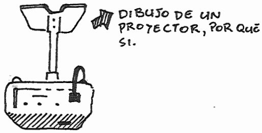
DIBUJO DE UN PROYECTOR, POR QUÉ SÍ.